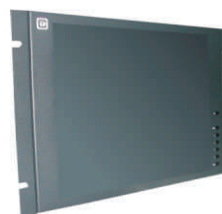
Accesorio rack 19" ref. AC170R