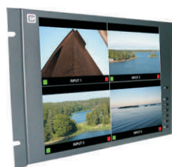
Accesorio rack 19" ref. AC170R