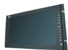
CA-PE15-17: Pie de sobremesa AC170WR: Kit montaje rack 19"

La información contenida en este documento esta sujeta a cambios