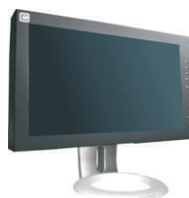
CA-PE15-17: Pie de sobremesa