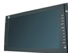
AC170WR: Kit montaje rack 19"

La información contenida en este documento esta sujeta a cambios