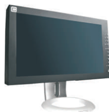
CA-PE15-17: Pie de sobremesa