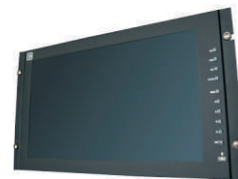
AC170WR: Kit montaje rack 19"

La información contenida en este documento esta sujeta a cambios