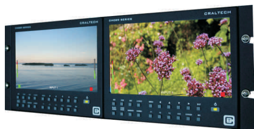
AC089R: Kit montaje rack 19"