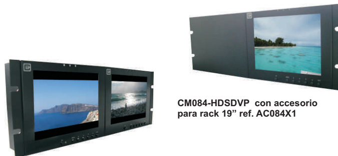
CM084-HSDVP con accesorio para rack 19" ref. AC084X1